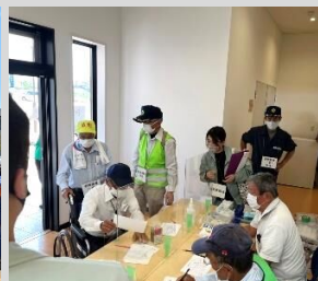
訓練：避難者の受付