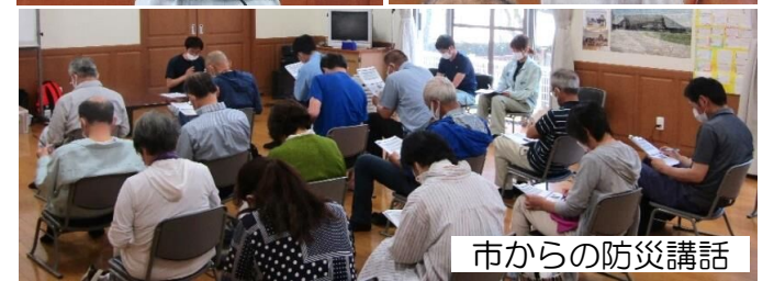
市からの防災講話