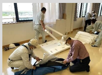
発泡スチロールベッド・パーテーション組み立て