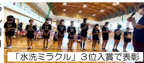
「水洗ミラクル」3位入賞で表彰