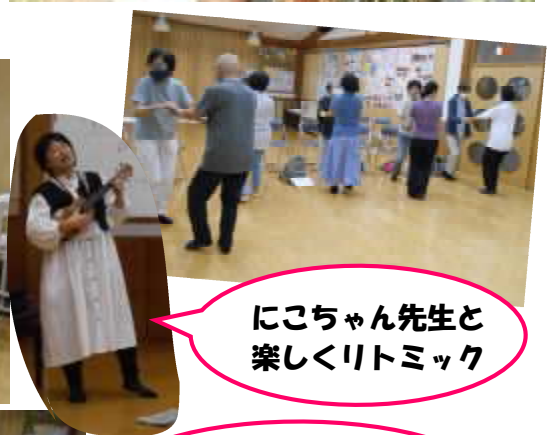
にこちゃん先生と楽しくリトミック