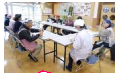
かんたんおやつ調理実習