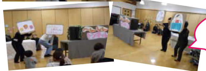
誕生会で「へんしんトンネル」の出し物をしました!