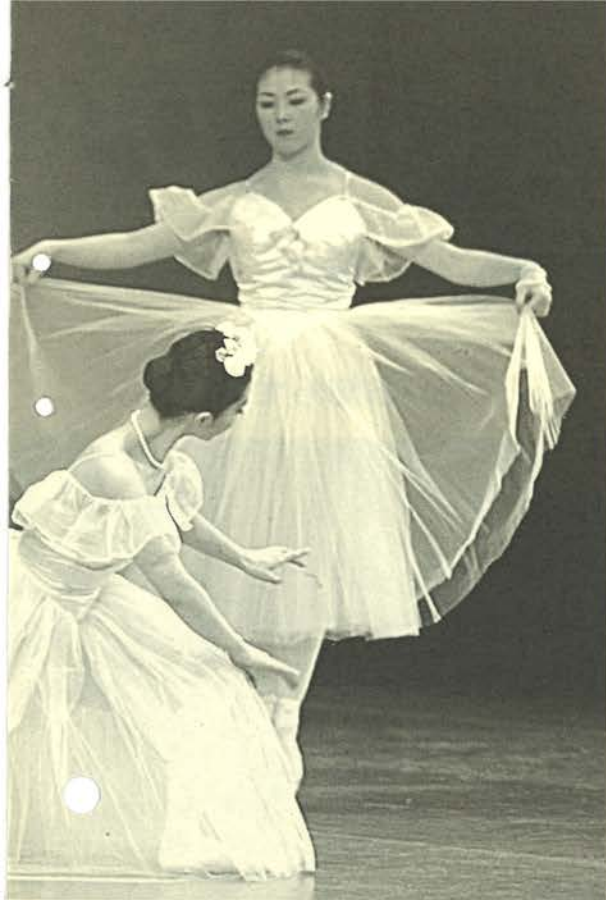
▲昨年の市民芸能のつどい