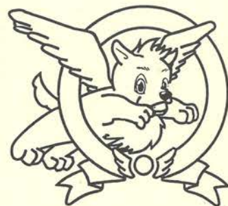
筑後市マスコットキャラクター "ちくご"