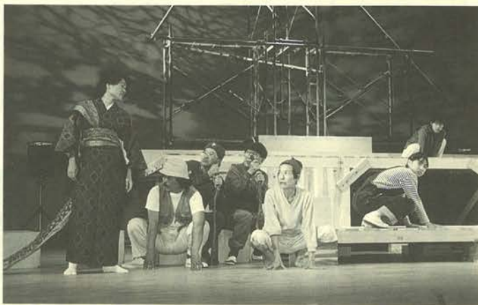
演劇教室発表会「ブンナよ木からおりてこい」

中央公民館の筑後ふれあい塾、演劇教室の第六回発表会が、十月二十六日、サザンクス筑後でありました。