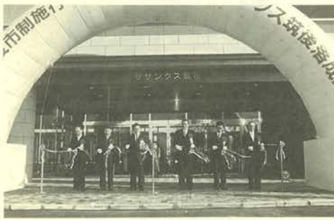
△サザンクス筑後の開館セレモニー