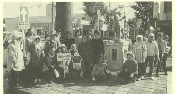
△苗植えを終えて記念撮影

筑後市では、昭和四十年代から企業誘致に力を入れ始め、JRや国道、高速道路等の交通条件に恵まれていることもあって、四十年