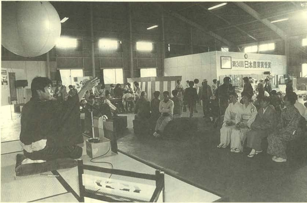
△「日本の量」をアピールする、「やすらぎの和空間 in ちくご」(10月7日～8日、農協本所で)

筑後市農協い業部会（江崎和幸部会長、九十六戸）が、十月二十日、平成七年度農林水産祭の畜系・地域特産部門で天皇杯を受賞しました。 筑後市からの天皇杯受賞は、昭和六十二年度（一九八七）の農協梨部会に続く二度目で、全国でもトップレベルの筑後市の農業がなし遂げた快挙に、称賛の拍手が送られています。