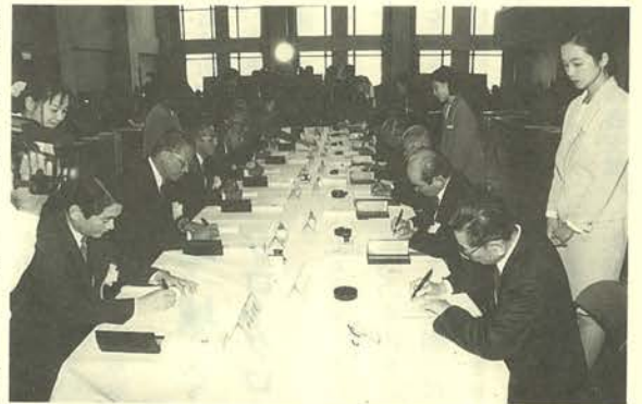
△ 8 農協の組合長と市町村長が勢揃いした調印式