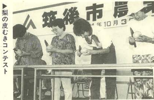
梨の皮むきコンテスト