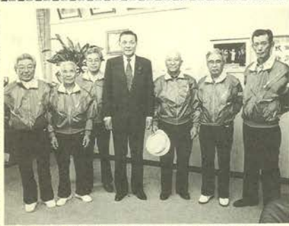
▲市長を訪問した選手団のみなさん

十月三十一日から十一月三日まで、山梨県で「健康福祉祭全国大会（ねんりんびつく'92）」が開かれます。