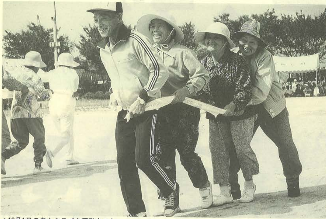
▲10月1日の老人クラブ大運動会から