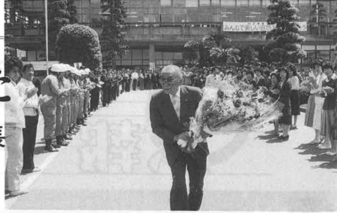
花束を手に拍手の中を退庁する田中市長（15日）