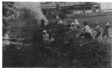
よみがえった川と水 —全市一斉清掃終わる—

5月11日から25日まで「川と水を守る市民運動（全市一斉清掃）」が行われ川や水路、下排水路などが見違えるように美くなりました。