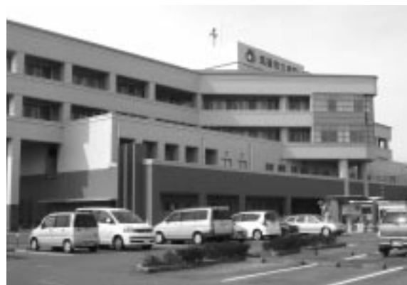
独法化される予定の筑後市立病院

市長 具体的方法はこれらだが、職員削減による人件費抑制は避けて通れない。業務を精査し、公的関与のあり方を検討した上で民間委託、指定管理者制度の活用、非常勤職員に担ってもらうことも、他に不要不急の事業廃止も含め、何ができるか慎重に検討したい。