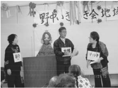
◀観客を前に劇を披露する団員