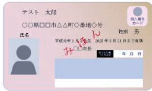
(表面) 個人番号カード