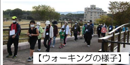
【ウォーキングの様子】