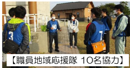
【職員地域応援隊 10名協力】