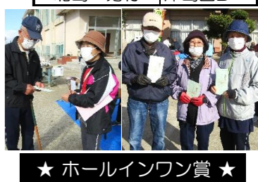
★ ホールインワン賞 ★