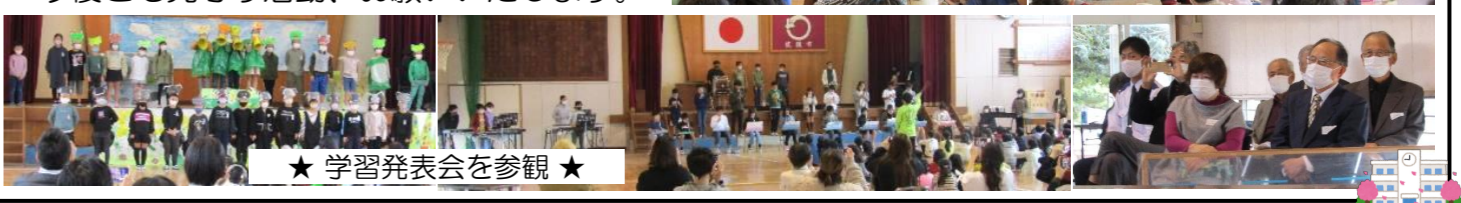
★ 学習発表会を参観 ★