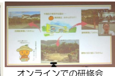
オンラインでの研修会