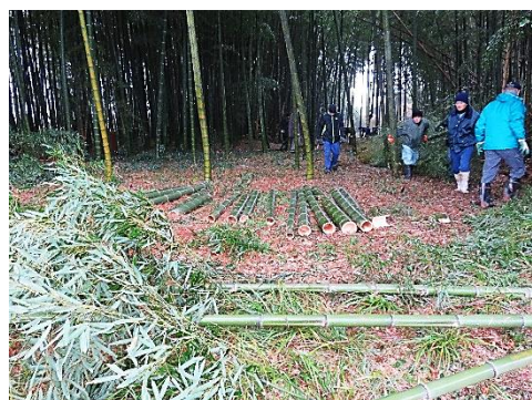
みなさんのご協力で、左義長・もぐら打ちは継続できています。