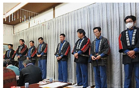
火の用心!皆さん、火の元にご注意を!!

12月28日、船小屋公民館では、水洗消防団の1年間の活動報告会が行われ、団員紹介や大会・訓練の成果等が報告されました。「日頃の訓練がいざという時の力になる」と、お話しがあり、仕事をしながら地域の為に頑張っている事に、大変感謝しております。