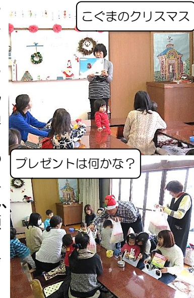
こくまのクリスマス