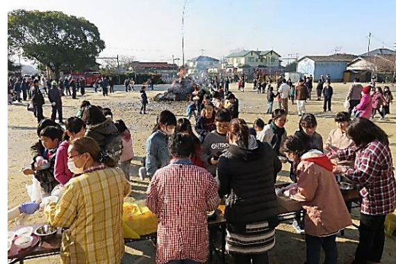
美味しいぜんざい、ありがとうございました