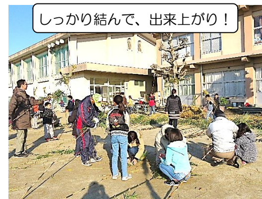
しっかり結んで、出来上がり！