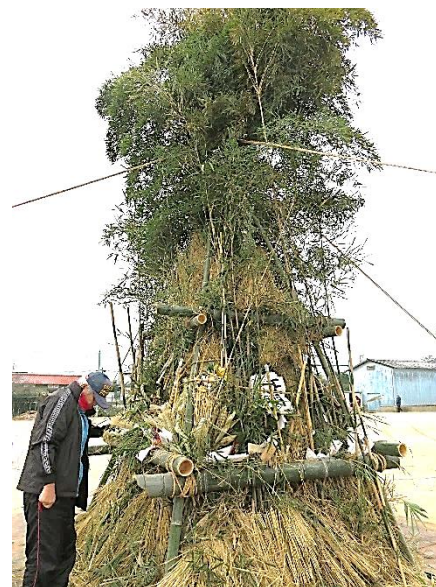
もぐら、逃げたかな？

なお、左義長の案内にもしめ縄の橙や針金・プラスチック等は外して持って来て頂くようお願いしていましたが、外されないままの物が多く見受けられました。灰の中に針金が残ったりすると、グラウンドを使う子ども達が危険にさらされるので、今後は外して持って来て頂くよう、よろしくお願い致します。