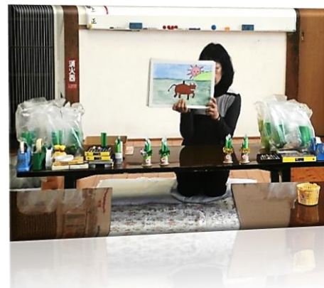
十二支の由来、紙芝居でよく分かりました