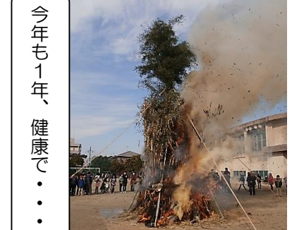
今年も1年、健康で・・・