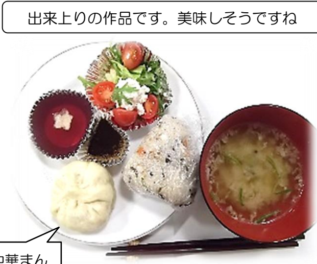
出来上りの作品です。美味しそうですね