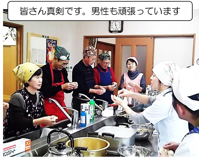
皆さん真剣です。男性も頑張っています