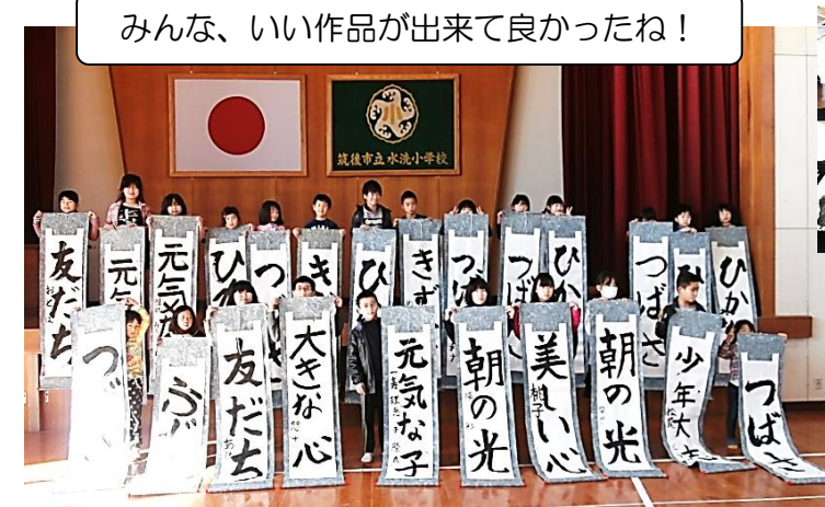
みんな、いい作品が出来て良かったね！