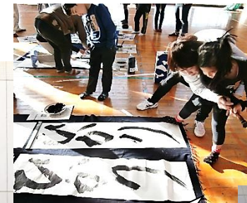
上級生は漢字が入り、文字数が多いです