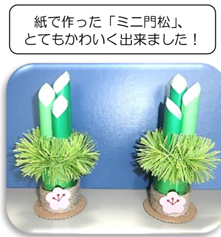
紙で作った「ミニ門松」、とてもかわいく出来ました！