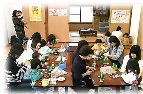
みんなで楽しく作品を作っています