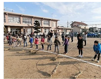
モグラ、行ったかな？

伝統ある左義長とモグラ打ちは、多くの方の協力により継続されています。感謝の気持ちを忘れず、今年も1年間皆さんが無病息災で健康に過ごせますように、と思いました。