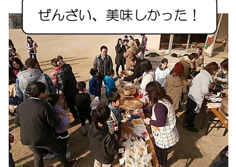
ぜんざい、美味しかった！