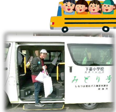
1人で最後の乗車となった6年生

3月18日(月)6年生の下校時刻に合わせて午後1時15分から『スクールバスみどり号』の終了式が行われました。