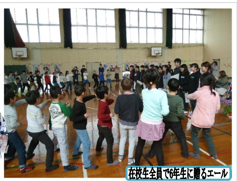
在校生全員で6年生に贈るエール