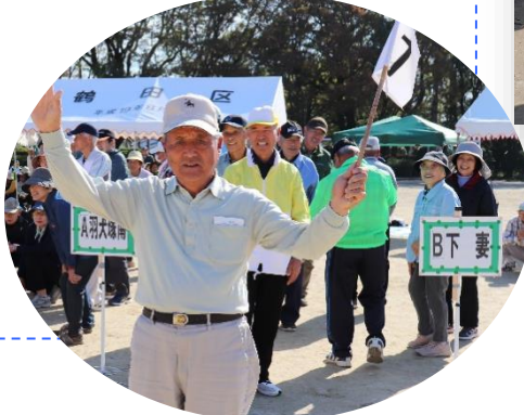
3位表彰を受ける中牟田区老人会長