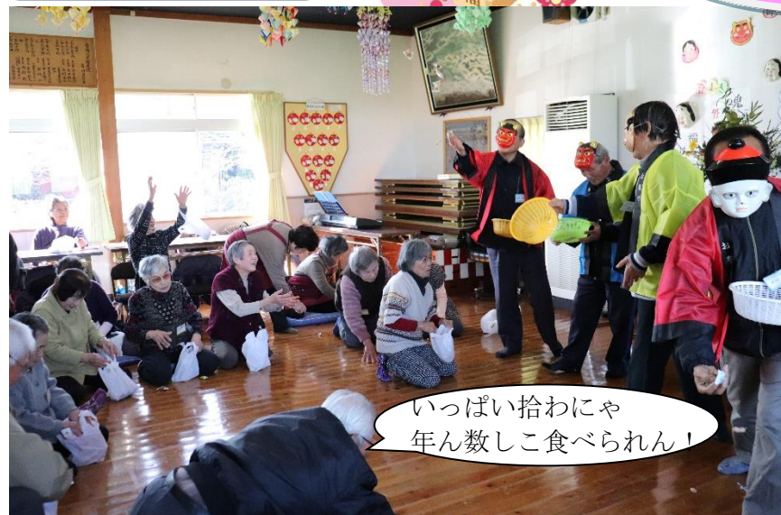
いっぱい拾わにや 年ん数しこ食べられん!

この日のデイサービスは43名の方が参加され、午前中は体操や恒例の豆まき、午後からはゲーム・ビンゴが行われました。頭と身体をたくさん使われた後は、おやつに美味しいぜんざいを頂き、皆さん大満足の一日を過ごされていました。