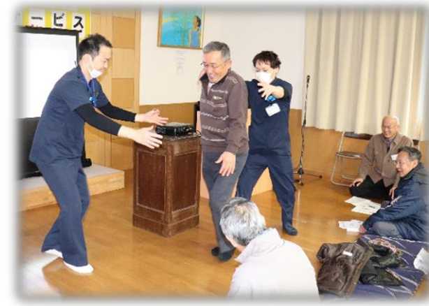
↑ロコモ度チェック中。あら!危ない!! →みんなで簡単なロコモトレーニング中

生活部会の取り組みの一つである健康講座を馬間田デイサービスの中で実施しました。この日は筑後市立病院の理学療法士を講師として招き、『健康寿命を延ばそう』と題して、ロコモティブシンドローム(通称ロコモ:運動器の障害による移動機能の低下した状態)を予防する運動の紹介をして頂きました。