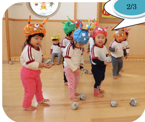
棕の実保育園も 豆まきしたよ!

今回の催し物は担任の先生に頼らず、3年生がすべて自分たちで考えたものだそうです。劇や落語、リコーダー演奏など盛りだくさんで参加された地域のみなさんを楽しませてくれました。