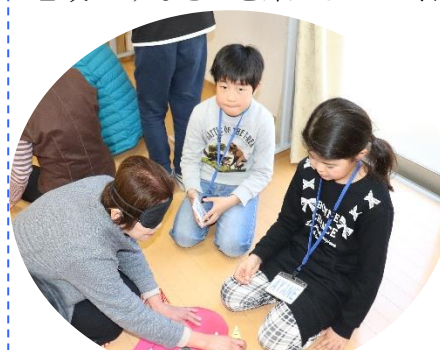
児童手作りの福笑い