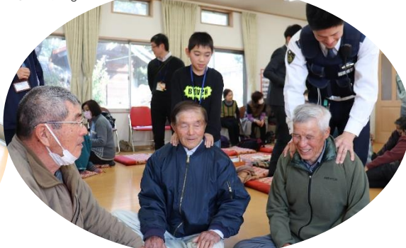
あ～気持ちよかあ!お巡りさんより上手!