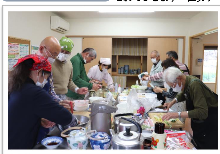
中牟田公民館で8名が参加し、男性料理教室が行われました。(メニュー:玉葱の海老のせ蒸し・磯辺焼き・スコーンなど) 3年間続いたこの活動も今回で終わりとなります。