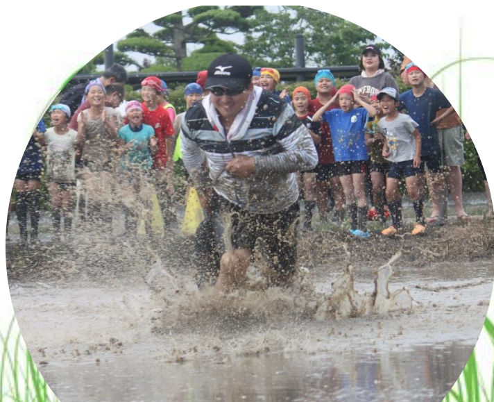
乗るも引くも息ピッタリ♡ 3年連続！校長&猪口先生ペア