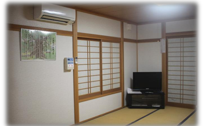
馬間田公民館（昼の部屋・クーラー完備）

平成30年6月21日に【災害時における自主避難所に関する協定】を筑後市と馬間田両行政区との間で正式に締結されました。