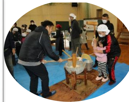
年中園児も再来年のために今から練習!