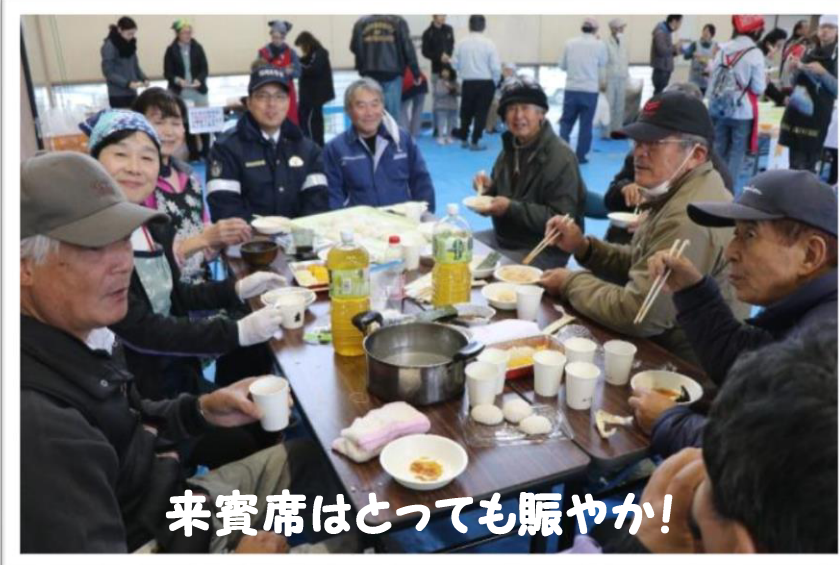
来賓席はとっても賑やか!