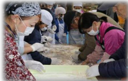
さあ!ちぎって丸めてもうひとがんばり!