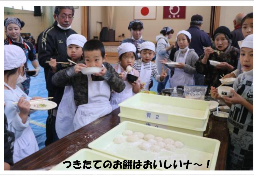
つきたてのお餅はおいしい+~!

12月16日は、小雨降る中、多くの来賓・地域の方々に来ていただき、「下妻公開の日」を開催することができました。