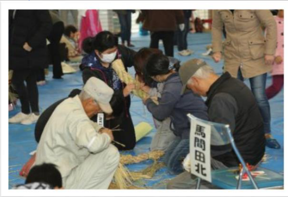
みんなで注連縄作り