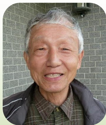
下妻校区老人会長