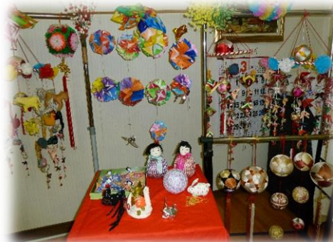
デイサービス会場に飾られた作品の数々