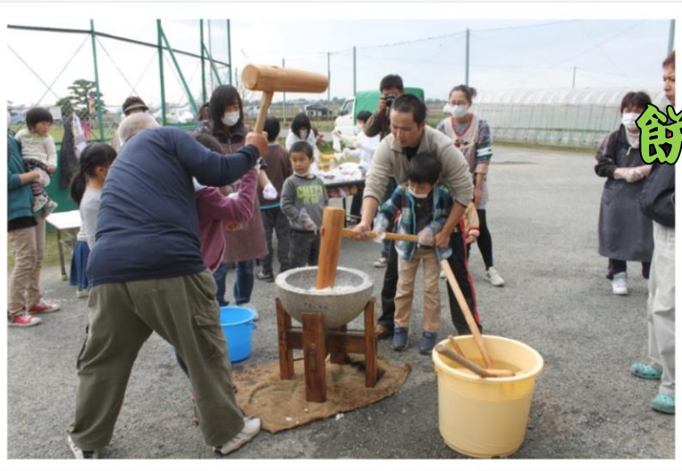
12月20日(日)『下妻小学校公開の日』が開かれ、注連縄づくりと餅つきが行われました。