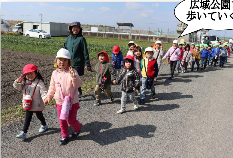
広城公園まで歩いていくよ!