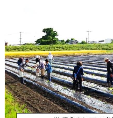
地域の方にコツを教わりました

5月14日(土)「ふるさとづくり部会」の部会員で芋苗植えを行いました。今年も美味しいさつまいもができますように。子ども会からは島田行政区の6年生が参加してくれました。ふるさとづくり部会の方に教わりながら、芋の苗を丁寧に植えていきました。