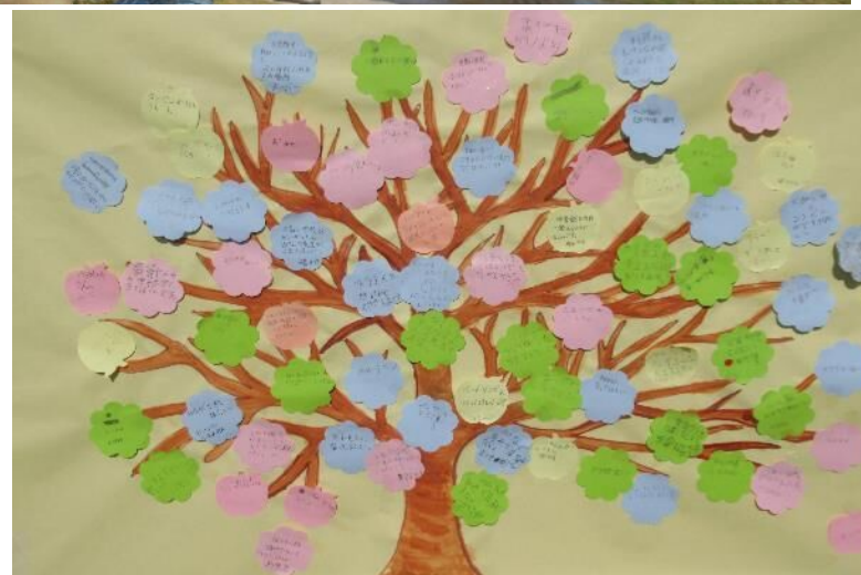
子どもたちにも再編後の小学校跡地に何が出来てほしいか、どんな古島になってほしいか、付箋紙に書いてもらいました。初めは、枝だけの木の絵でしたがみんなが意見を出してくれたので、満開の木になりました。