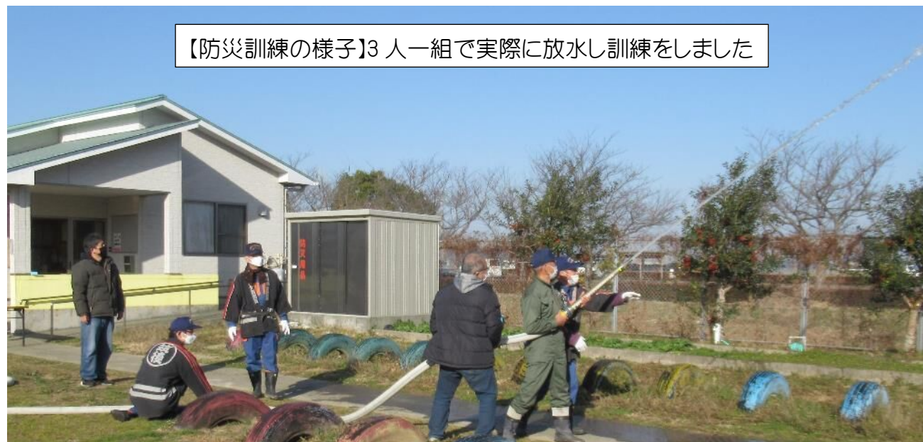
【防災訓練の様子】3人一組で実際に放水し訓練をしました

同日に行われた、防災訓練では「防災無線の使い方」(各行政区に設置されている防災無線を実際に使って放送)「避難訓練」「消火栓を使用した消火訓練」が行われました。