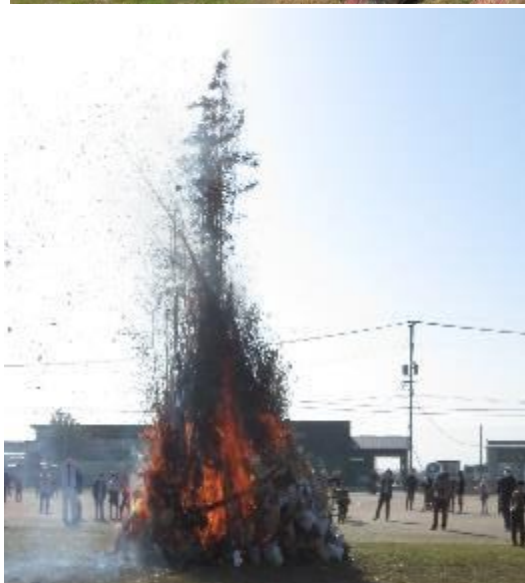
6年生が火入れをしました。毎年、火の迫力は感動します。今年も良い年になりますように...