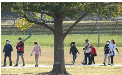
【ウォーキングの様子】 景色を楽しみながら歩きました。