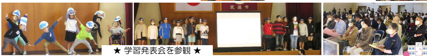
★ 学習発表会を参観 ★