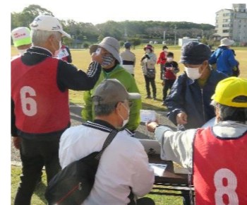
【新型コロナ対策】 消毒・検温等の実施