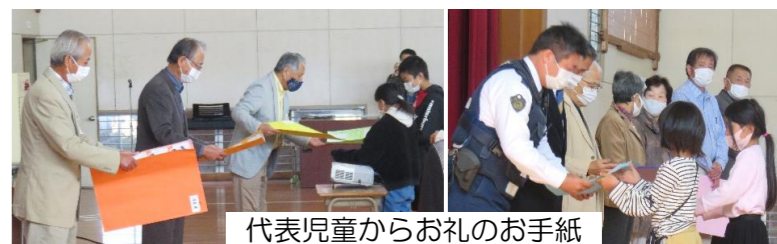
代表児童からお礼のお手紙