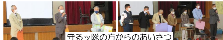
守るッ隊の方からのあいさつ