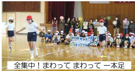
全集中!まわってまわって一本足