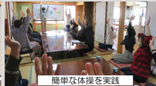
簡単な体操を実践