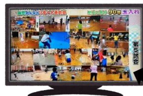
歴史を刻め 90年 玉入れ