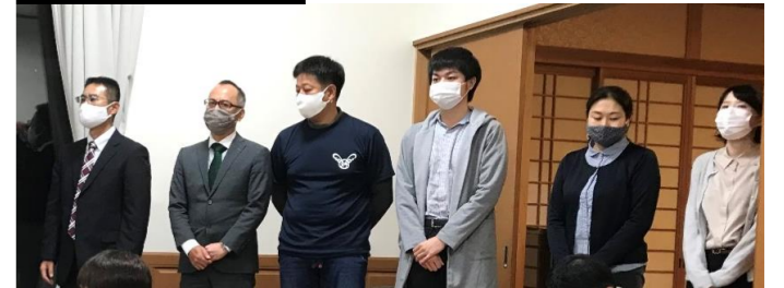
水洗校区メンバー

「職員地域応援隊」は11月6日の発足とともに各協議会からの派遣依頼の受け付けが始まっており、当協議会においても「職員地域応援隊」の応援をいただきながら、主催する事業のさらなる活性化に向けて取り組んでいきたいと考えています。