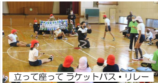
立って座ってラケットパス・リレー