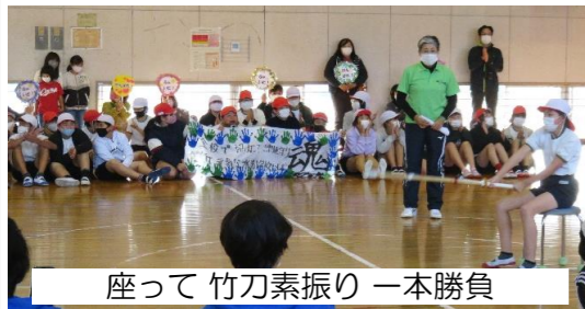
座って竹刀素振り 一本勝負

コロナ禍の中、スポーツ大会が難しい今だからこそ、県民の皆様と一緒に、福岡発の新しい試みができないかとの思いで生まれたこの企画ですが、子ども達にとって思い出に残る素敵な一日となったようです。