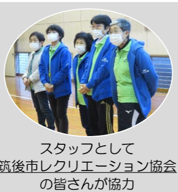
スタッフとして 筑後市レクリエーション協会の皆さんが協力