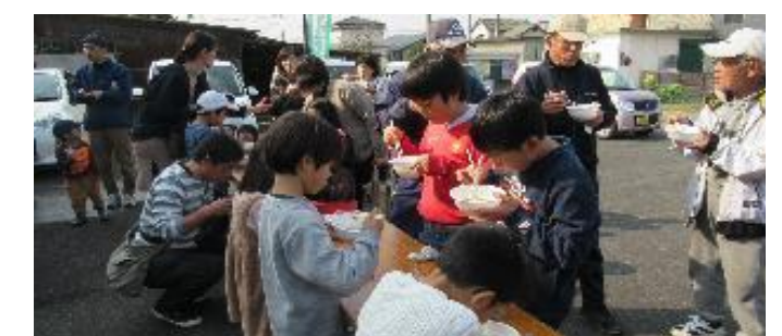
からだを動かした後は、美味しい豚汁におまんじゅう