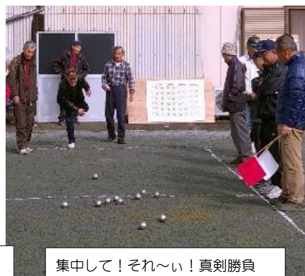
集中して！それ～い！真剣勝負