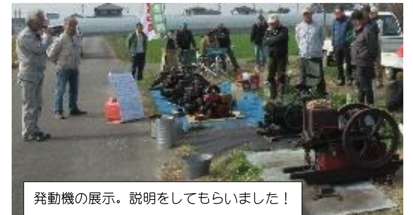
発動機の展示。説明をしてもらいました！