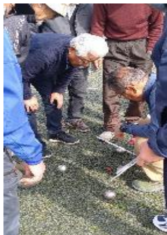
どちらが近いか、只今審議中！

2月14日（金）10時から井田下公民館にて行われました。前日は雨が降り、当日も雨かもと心配していましたが、とても2月とは思えないポカポカ陽気！風もなく、ペタンクを楽しみました。16チーム（行政区長会 2チーム・公民館チーム2チーム・福祉会2チーム・老人会10チーム）が参加されました。優勝は折地行政区Bチーム、2位は公民館A、3位は区長会Bでした。