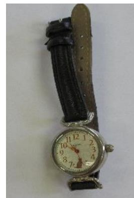
腕時計は12月頃、駐車場に落ちていました。