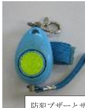
防犯ブザーとサングラスはグラウンドゴルフ大会の時、運動場に落ちていました