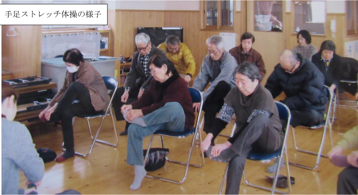
手足ストレッチ体操の様子

講座「介護保険制度」についてお話をして頂きました。午後より昨年同様レクリエーションにペタンク大会を行いました。皆さん元気に競技され勝ち点が入ると歓声上がり笑顔で楽しい一日を過ごしていただきました。(折地作出行政区 区長)