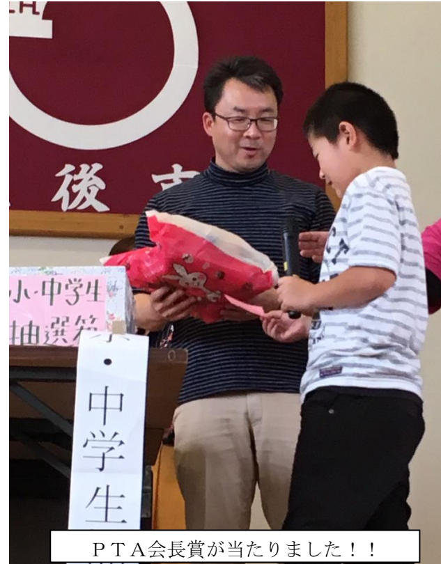
PTA会長賞が当たりました！！