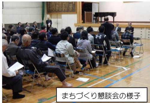
まちづくり懇談会の様子