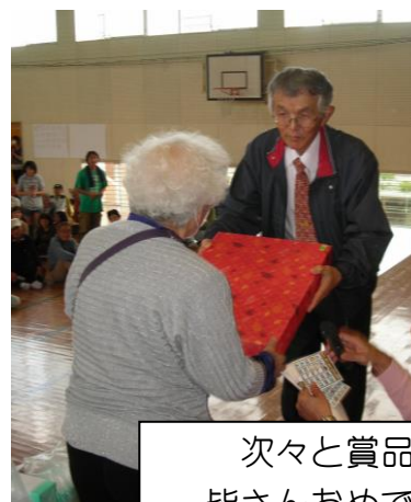
次々と賞品が手渡されます。 皆さんおめでとうございます。