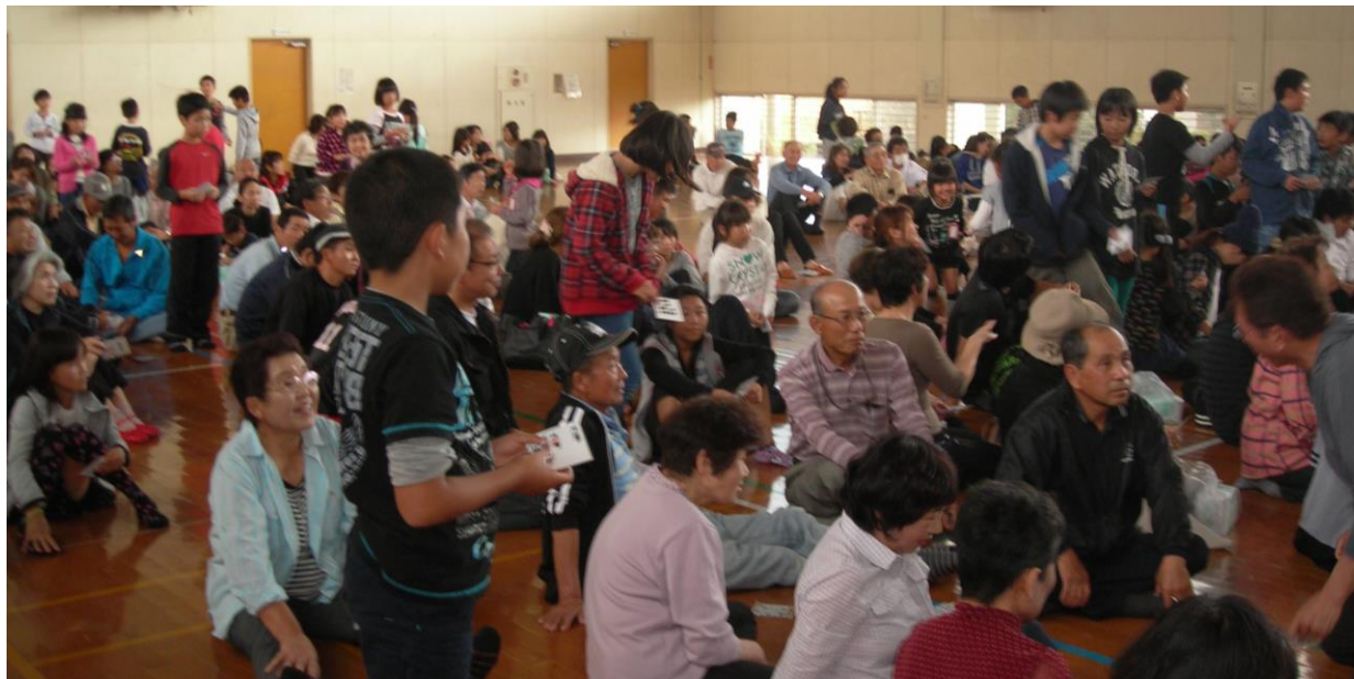
ビンゴ大会。リーチの方は、立ってもらってビンゴの瞬間を待ちますが・・・ たくさんいるのになかなかビンゴになりません。