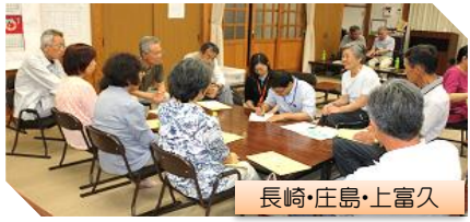
長崎・庄島・上富久