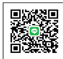
筑後市 16（対策本部）QR コード