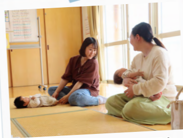
ハロートーク(利用者同士で自由におしゃべり)

「赤ちゃん訪問」のときに、保健師さんに紹介されて「みんな来んね♪」に参加しました。「お父さんと遊ぼう」や、「いもほり」などの季節のイベントにも参加してみたいと思いました。