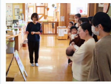
おひさまハウスの施設案内