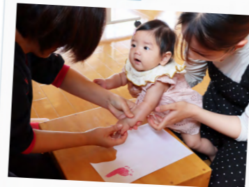
子どもの手形・足形取り