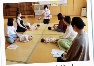
ファミリー・サポート・センターの紹介