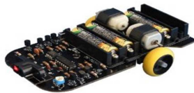
光センサー・プログラミングカー