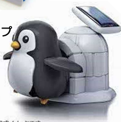
※完成イメージです。 ソーラーチャージ!とことこペンギン