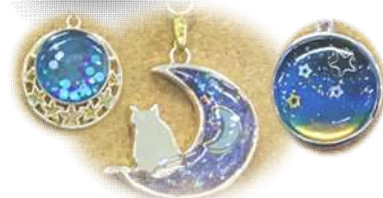
レジンで作る手作りアクセサリ